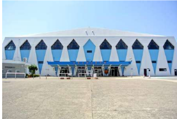
■和歌山県立体育館