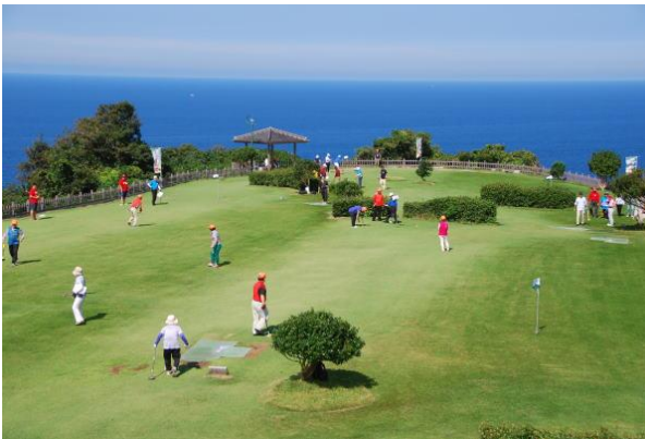
■グラウンド・ゴルフのふる里公園 「潮風の丘とまり」