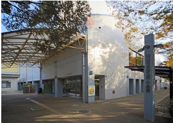
■京都市市民スポーツ会館