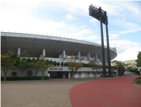
■ほっともっとフィールド神戸