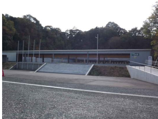
■和歌山ライフル射撃場