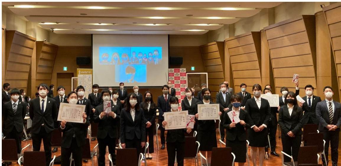
インターカレッジ・コンペティション 2020 表彰会場（2020年12月16日開催）