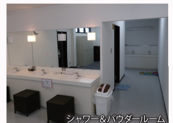
シャワー&パウダールーム