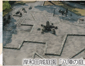
岸和田城庭園「八陣の庭」

海に面し、山脈に囲まれたこのまちは、四季を通じて多様な魅力に満ちあふれています。 それを背景に、江戸時代の古くから街道が整備され、今日に至っても都市的な利便性を備え持ちます。