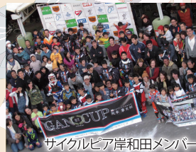
サイクルピア岸和田メンバー

本大会に熱意を持つ、市民の方々やBMX・自転車が好きな方々がボランティアとして皆様をお迎えします。 大会に関わる多くの方々と一丸となって皆様を応援し、皆様と一緒にスポーツの感動を共有できるようサポートします。