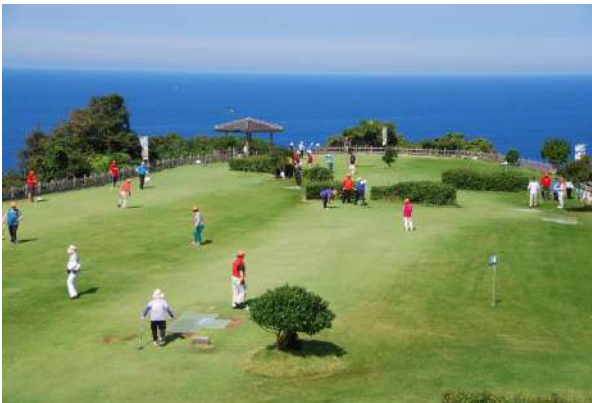
■グラウンドゴルフのふる里公園 「潮風の丘とまり」