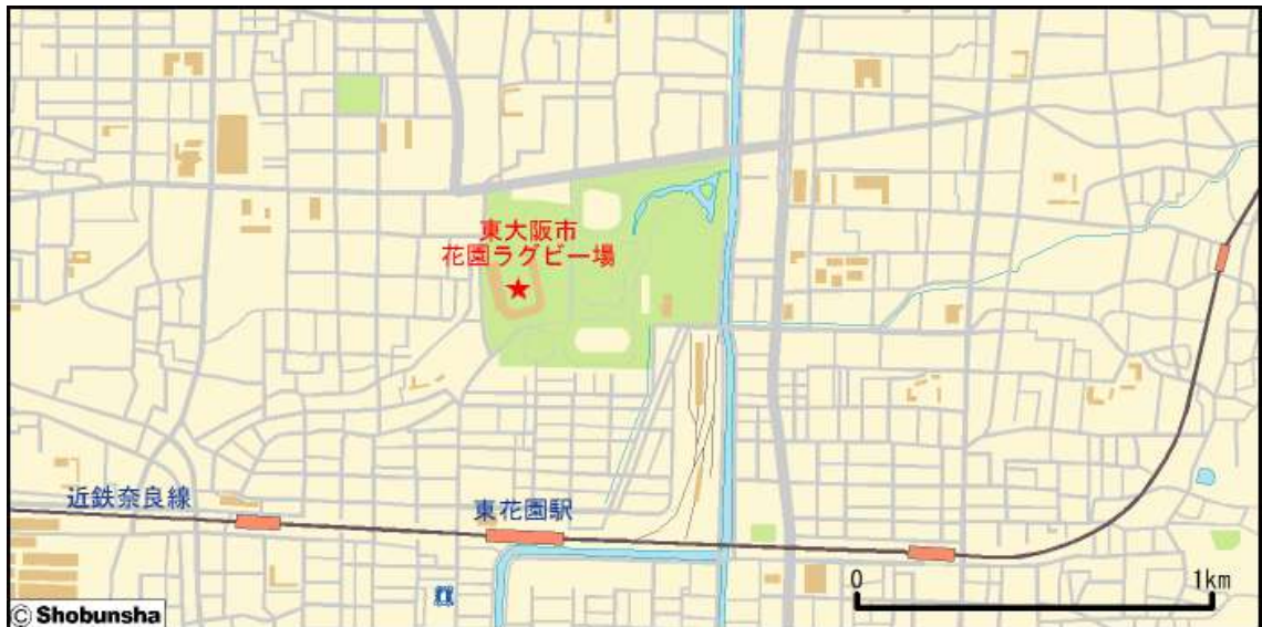
■ 東大阪市花園ラグビー場