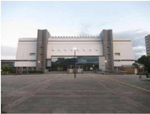
■神戸市立中央体育館