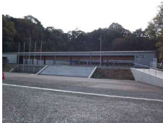
■和歌山ライフル射撃場