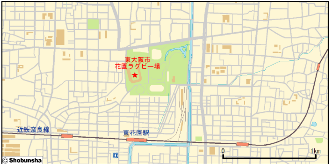
■ 東大阪市花園ラグビー場